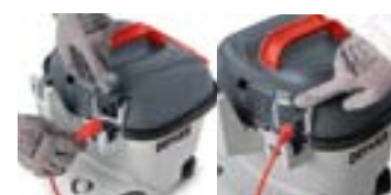
Einfach, werkzeugloser Wechsel des Netzkabels.