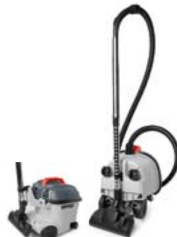
Zwei Parkhalterungen zum einfachen Verstauen des Teleskoprohres.