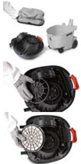
Mehrstufiges Filterverfahren: Papierfilter, Filtersack, Zu- und Abluftfilter.