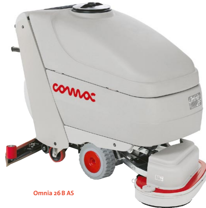
Omnia 26 B AS

Herausragend in punkto Bürstdruck, Absaugung und Laufzeit (bis zu 5 h). Extrem starker 36V Motor, gekapselter Fahrmotor mit Differentialantrieb (ohne Ketten, ohne Riemen). Die robuste Bauweise garantiert eine lange Lebensdauer und geringste After-Sales-Kosten.