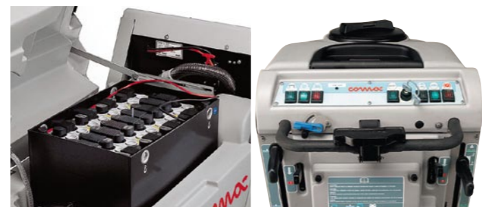
Batteriekasten für Dauereinsätze auch mit Trog erhältlich.