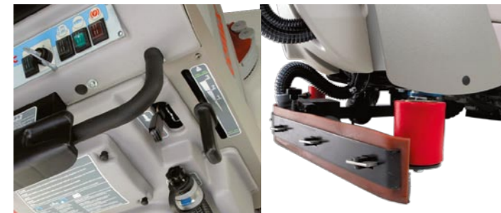
Bürstdruck in drei Stufen regulierbar. Sauglippen vierfach verwendbar und werkzeuglos abnehmbar.