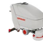
Eine extrem benutzerfreundliche Maschine dank des klar strukturierten Instrumentenboards mit Statuslampchen.