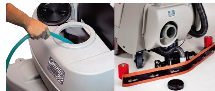
Schmutzwassertank leicht zugänglich und gut zu reinigen. Er hat einen langen Ablassschlauch und zwei große zusätzliche Öffnungen.